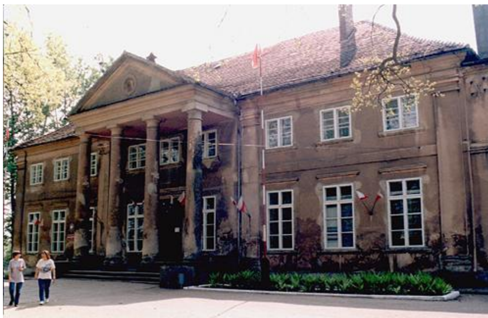
Pałac w Mchach