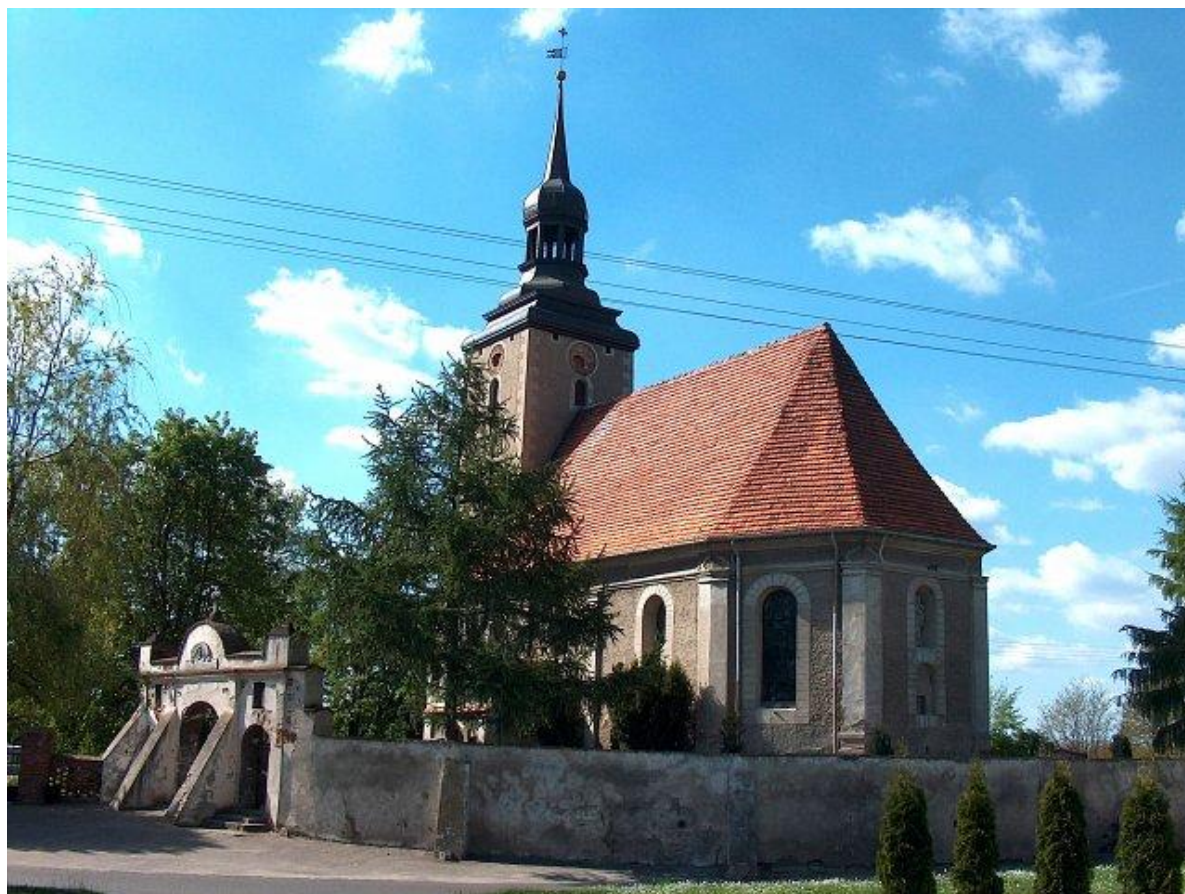
Kościół parafialny pw. św. Marcina Biskupa