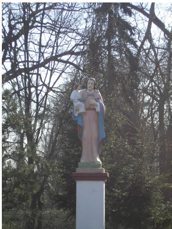
Figura św. Józefa

Rozważając temat mchowskich świątków należy jeszcze wspomnieć o grocie Matki Boskiej z Lourdes, która znajduje się przy kościele pw. św. Marcina Biskupa. Powstała ona w latach 50-tych XX wieku.