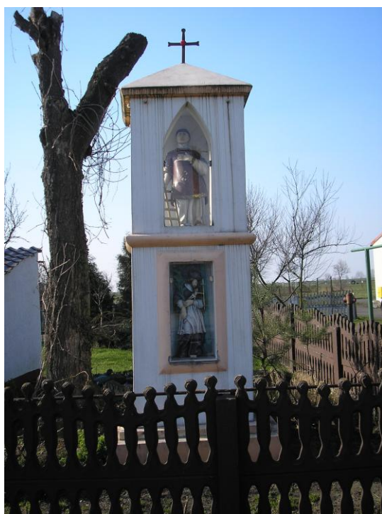
Figura św. Wawrzyńca i płaskorzeźba z wizerunkiem św. Jana Nepomucena