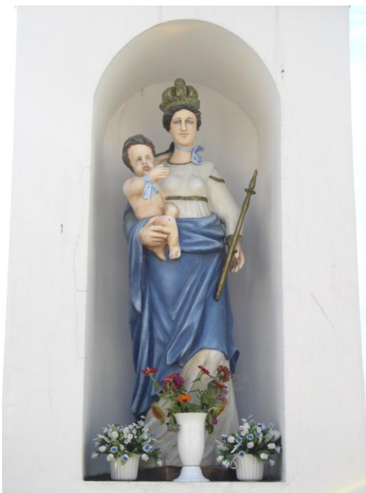
Figura Matki Boskiej z Dzieciątkiem Jezus