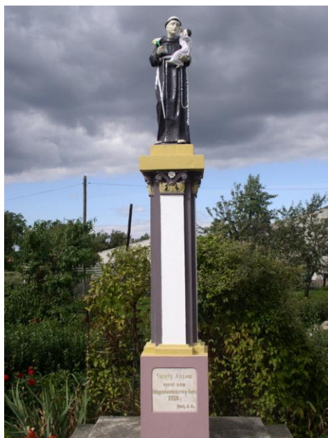
Figura św. Antoniego Padewskiego